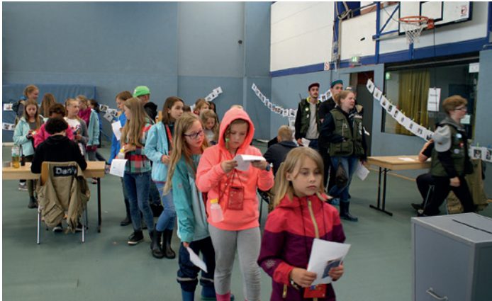
Vor den Wahlkabinen bildete sich eine lange Schlange.

Die Wahl zum Bürgermeister in Stormini ist am Mittwoch. In der Sporthalle wird das Wahllokal aufgebaut. Alle Kinder und alle Betreuer haben eine Stimme bei der Wahl. Wer gewählt wurde, erfahren die Kinder in einer Sonderstadtstunde am Abend.