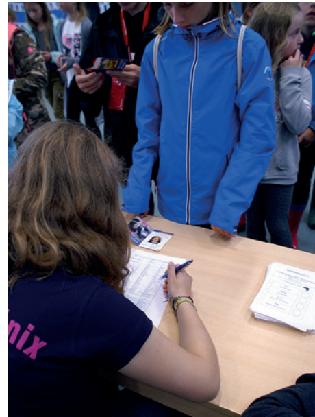
Jeder Bewohner von Stormini hat eine Stimme.